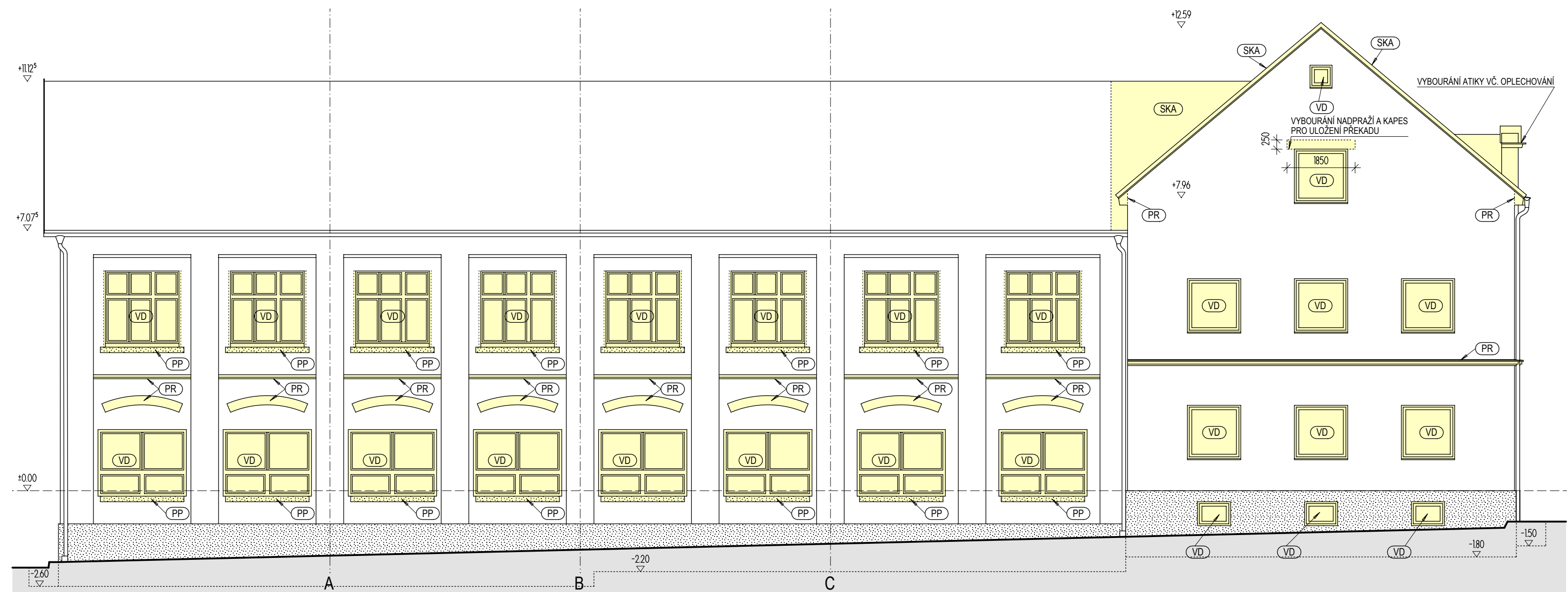
SEVERNÍ POHLED 1